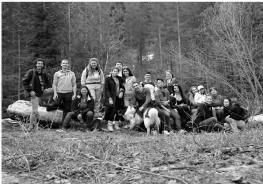
Фотография 30. Физически упражнения на т.нар. сечище (осми семинар, 12 май 2017 г.)