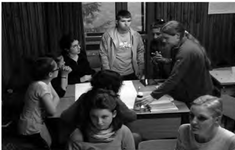
Фотография 18. Студенти от специалност Педагогика представят работата си (22 май 2016 г.)