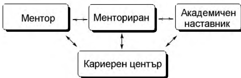
Модел на менторство във ФП