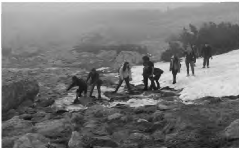
Фотография 38. Близо до Еленин връх (2654 м.н.в.), 20 май 2012 г.

... и продължаваме нагоре през препятствията (и двете фотографии, свързани с този текст, са от 19 май 2018 г., девети семинар)