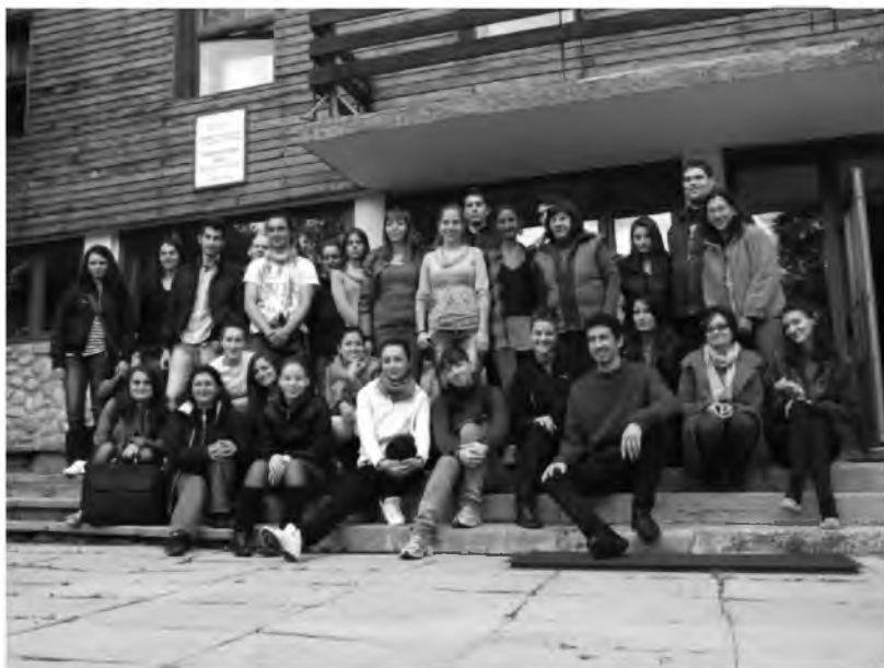
Фотография 7. Участниците в четвъртия семинар (19 май, неделя 2013 г.)