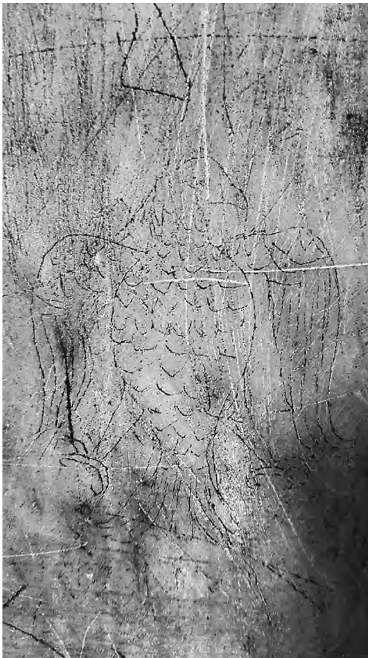
Рис. 1а. Рисунок-графит на едноглав орел