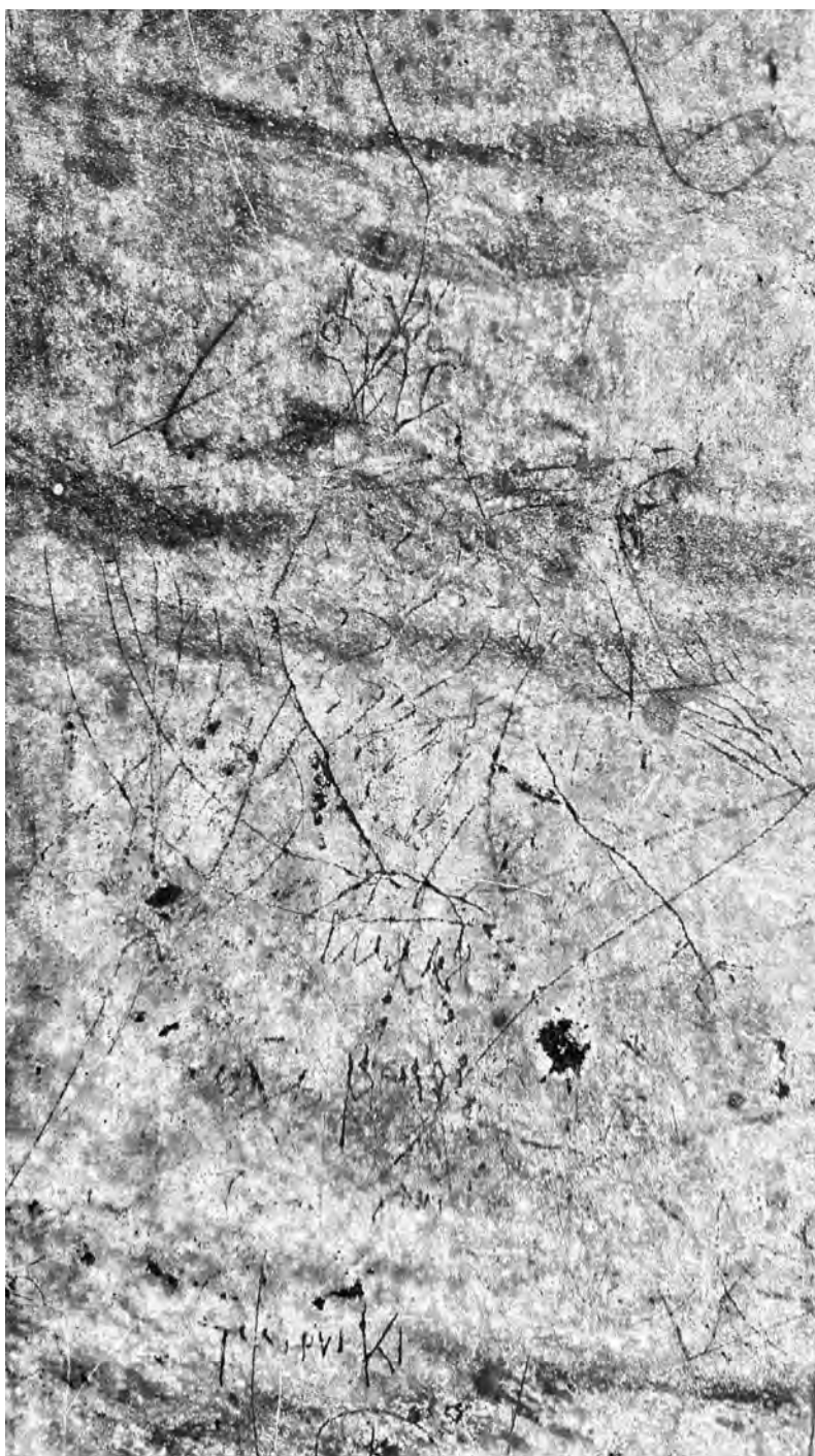
Рис. 2а. Рисунка-графит на двуглав орел