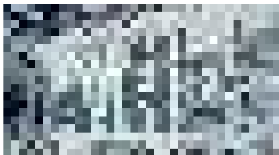
„Националистически“ графити / град София, ул. Неофит Рилски № 66 и гара Подуяне