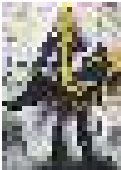
Станислав Беловски „Путин и мъртвото му тяло“ (2022) и реакцията на обществото (2023)