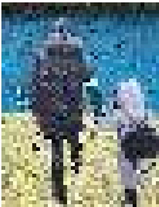
Графитите на Станислав Беловски и новата реалност / град София, ул. Цар Иван Шишман (2022)