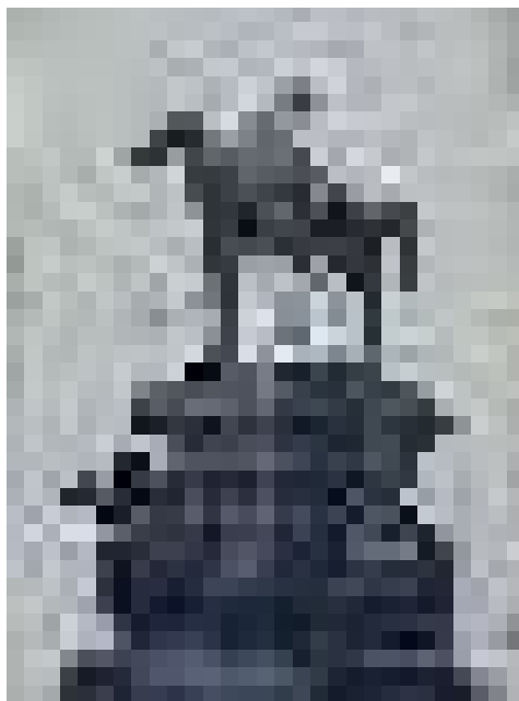
Станислав Беловски / Заличен графит в град София на ул. Иван Вазов № 6