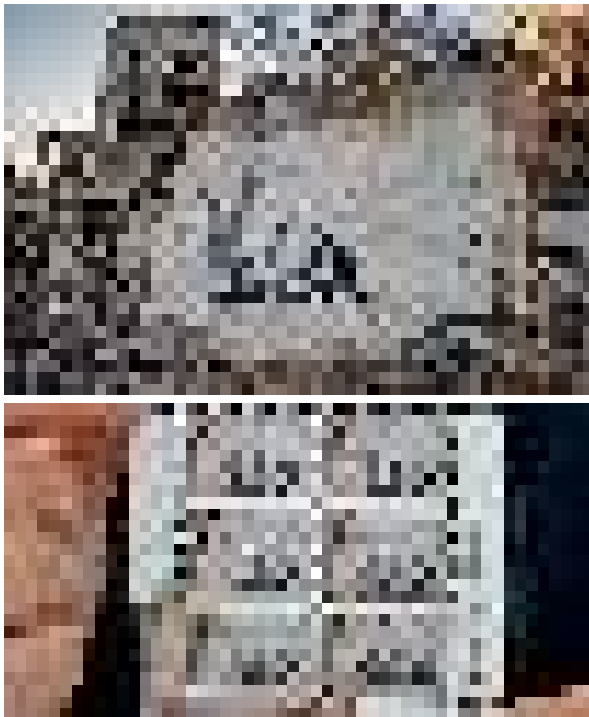
Графитите на Банкси и техните употреби / Украйна, град Бородянка (2022)

в град Бородянка, близо до столицата Киев“. Нещо повече – „много украинци виждат стенописа на Банкси като метафора на яростната съпротива на Украйна срещу инвазията“ (Frog news 2023). Пощенската марка е форма на изразяване, която предполага изпращане и „разнасяне“ на посланието по всички краища на света, като независимо дали това се случва на практика, метафората и формата внушават подобни очаквания. Доколко обаче метафорично използваната библейска притча за Давид и Голиат, превъплътена в коментирания графит и превърната в пощенски марки, би могла да се определи като пропаганда?