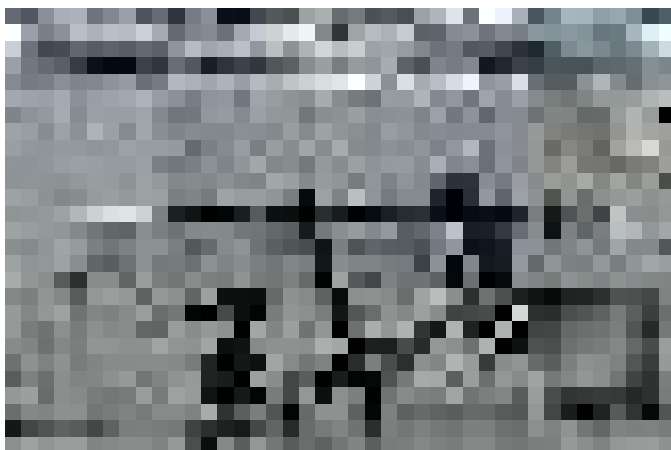
Графитите на Банкси и новата реалност / Украйна, Централният площад в град Киев (2022)