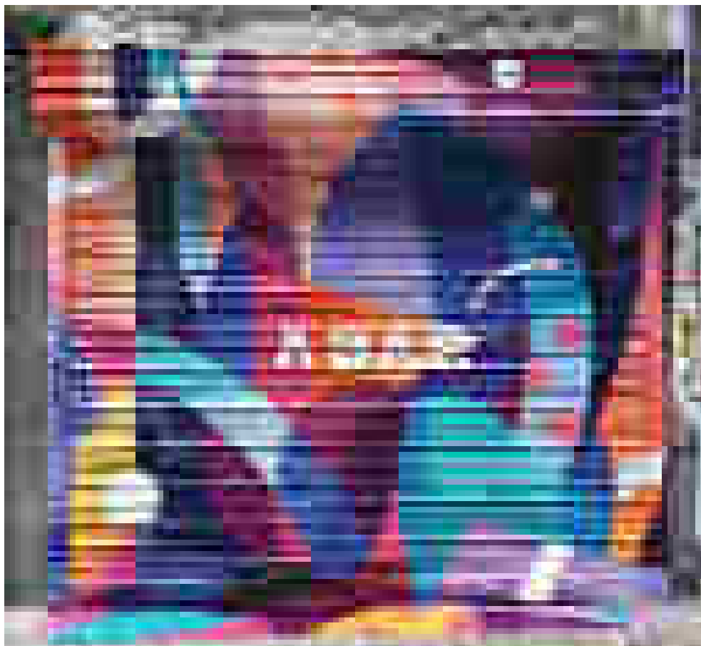
Графити в София / Парчета / ул. „6-ти септември“ №26 Б

ване и приемственост като компоненти на понятието „наследство“ изискват намесата на публичните власти при опазването на разширеното с „парчета“ и „стенописи“ многообразие от монументални форми като част от културната памет на града и обществото.