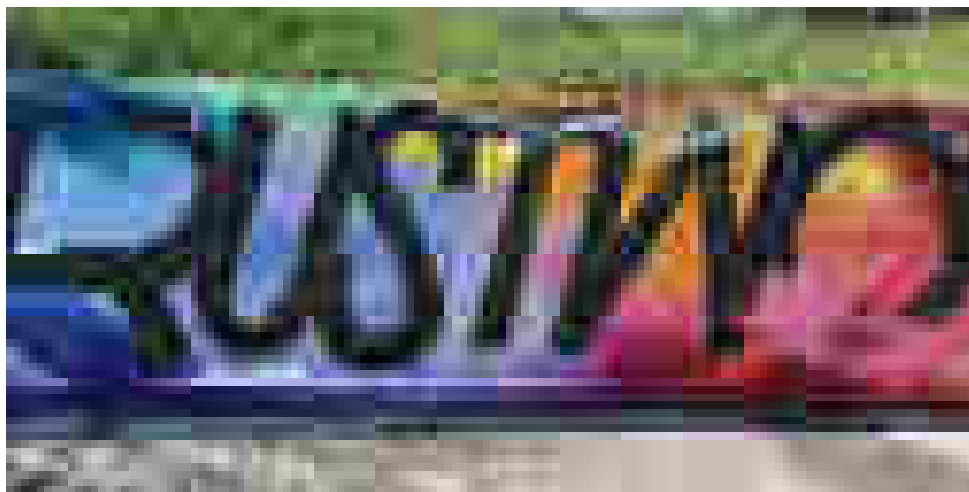
Графити в София / Тагове / „Сухата река“, ул. Витиня

мисъл и дебат по актуални теми и проблеми, включително и по отношение на начина по който функционира системата за пазарна реализация на изкуство 4 .