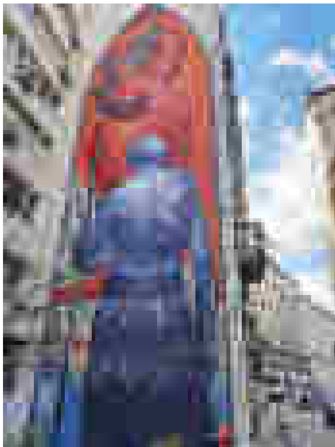
Графити в София / Стенопис / ул. „Триадица“ №6

мет, която стои в основата на (2) градската среда с памет, чието припознаване от следващите поколения като ценност конституира (3) градско наследство с демократичното участие и артистичните интервенции на различни общности и групи при промяната на градската среда като същевременно се отчита и опазва и наследената памет от предходни поколения. Добър пример в това отношение са организираният от „Sofia Graffiti Tour“ маршрути предимно на територията на град София, които представят с образователна насоченост многообразието от графити. По този начин те формират визуалната култура както на гражданите, така и на ползвателите на коментирания маршрут 12 , но преди всичко третират улицата като място на културна памет, а графитите като ново градско наследство.