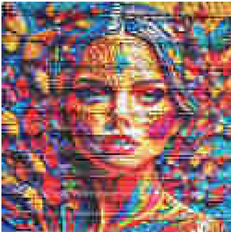
Графити в София / Парчета (принт) / ул. „Ангел Кънчев“ №25 / (Сн. © Иван Кабаков)

турология, архитектура, градоустройство, пластични изкуства, изкуствознание, туризъм, социология и др.“