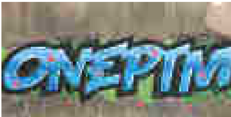
Графити в София / Тагове / Търговски център „Сердика“ / (Сн. © Иван Кабаков)