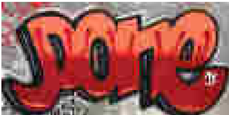
Графити в София / Тагове / гара „Подуяне“