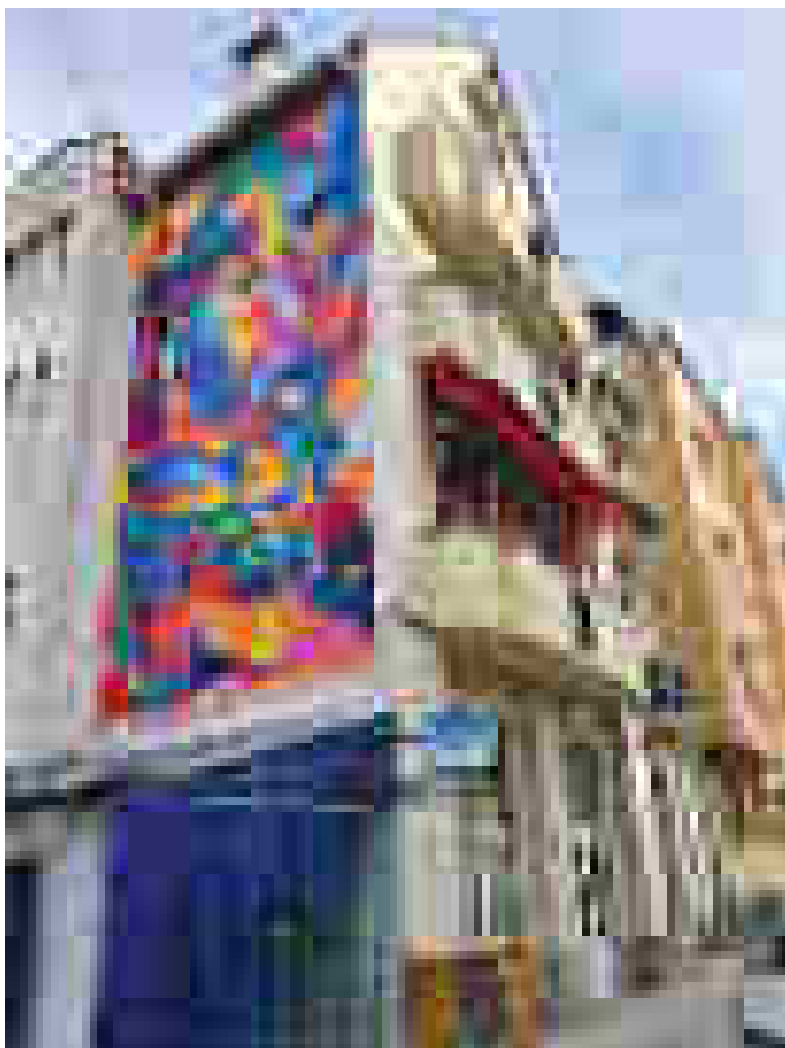
Графити в София / Стенопис / ул. „Бачо Киро“ №38

Когато се анализира работата на Експертно-художествения съвет 10 , практиката показва, че има както одобрителни становища за изработването на графити (например Протокол № 23 от 13.06.2019 г. на Експертно-художествения съвет или Становището от заседание на Експертно-художествения съвет, проведено на 19.05.2022 г. в отговор на писмо с рег. № СКК22-ТД26-48/05.04.2022 г., свързано с изрисувването на стенопис на украинската художничка Вики Книш на калкана на зала „България“), така и становища