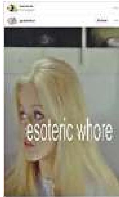
Фиг. 9. Препубликуван пост от потребителката @bambiali, който съдържа изображение с текст esoteric whore.

Зърнестото изображение, подобно на кадър, заснет от филм или любителска снимка, имитира честотата и визуалния стил, характерни за VHS културата, предизвиквайки чувство на носталгия по отминали епохи. Комбинацията от руса коса, черна очна линия, розов блясък и бледосиня блуза създава външен вид, който слива невинност с преувеличена форма на женственост.