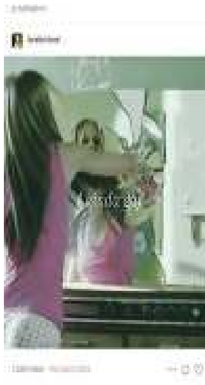
Фиг. 3. Препубликуван пост от потребителката @sweetangel1111, който съдържа изображение с текст i kinda gaf .

Тази форма на изразяване притежава значителен перформативен аспект, както е формулирано в изследването на Бътлър за езика, тялото и травмата. Тя постулира, че афектът представлява действие или нещо, в което участвате, представяме или изпълняваме. Изследователката твърди, че езикът не само оформя социалното тяло, но също така може да му нанесе вреда – не чрез физическо насилие, а чрез вербално „обръщение“, което влияе върху