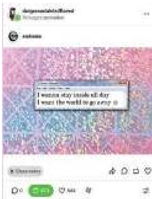
Фиг. 1. Препубликуван пост от потребителката @dangeroustainedflawed, който съдържа изображение с текст I wanna stay inside all day / I want the world to go away :).

Потребителката @dangeroustainedflawed въплъщава естетиката на „тъжното момиче“, като артикулира нейния копнеж за самота и откъсване от обществото по начин, характерен за тази културна тенденция. Този израз се предава предимно чрез използването на „ретро“ визуални елементи, които „проговарят“ на езика на носталгията. В конкретния случай постът ѝ съдържа бележка от приложението Notepad на Windows 7 . Това би могло да се класифицира като „ретро“, тъй като Windows 7 е пуснат през 2009 г. и става широко достъпен на 22 октомври същата година. Тази версия е изместена от Windows 8 през 2012 г., а през 2020 г. поддържането ѝ се преустановява.