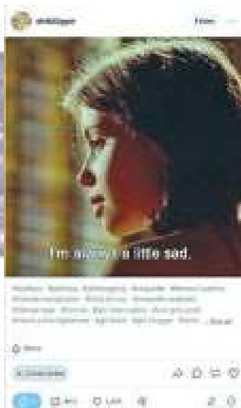
Фиг. 7. Оригинален пост от потребителката @shitbl0ger, който съдържа изображение с текст I'm always a little sad .