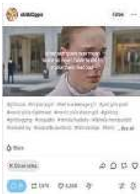
Фиг. 4. Оригинален пост от потребителката @shitbl0ger, който съдържа изображение с текст when someone was mean to me so now I have to die to make them feel bad.