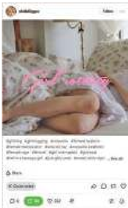
Фиг. 2. Оригинален пост от потребителката @shitbl0gger, който съдържа изображение с текст girl rotting .

Артикулирането на страданието се проявява не като пряка изповед, а чрез визуални метонимии на болката: легло, където момичето лежи, завито с одеяла, придружено от фразата girl rotting (shitbl0gger, март 2025); колаж с бял сутиен и руса коса, изцапана с кръв; отворена бутилка до разпръснати розови хапчета (антидепресанти) върху мивка в банята; кадър от музикален видеоклип, изобразяващ изпълнителката Аврил Лавин, която разбива огледало в яростта си (sweetangel1111, март 2025), надписан с i kinda gaf 2 (фиг. 2 и 3).