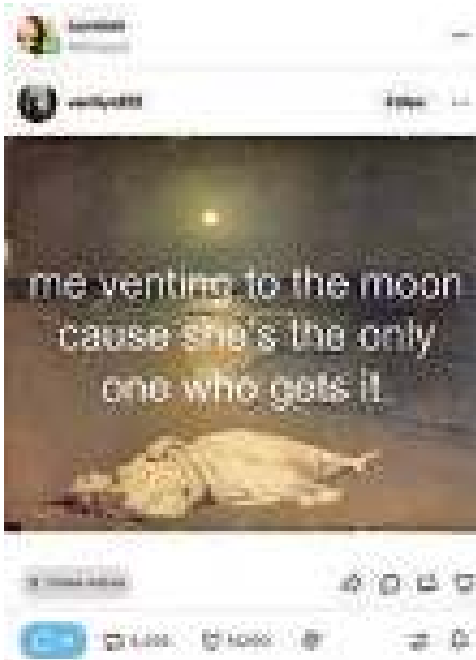
Фиг. 8. Препубликуван пост от потребителката @bambiali, който съдържа изображение с текст me venting to the moon cause she's the only one who gets it.