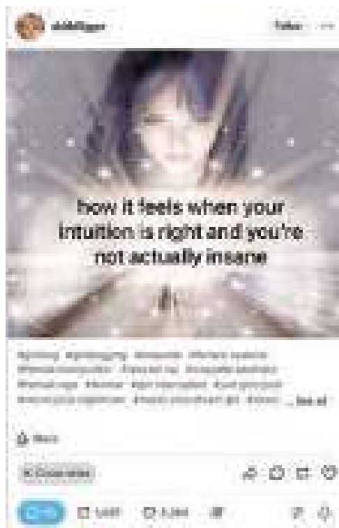
Фиг. 6. Оригинален пост от потребителката @shitbl0ger, който съдържа изображение с текст how it feels when your intuition is right and you're not actually insane .